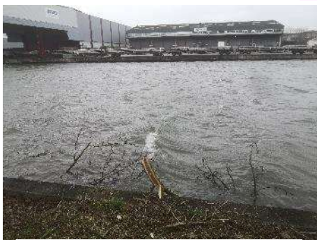
Quand les branches se noient