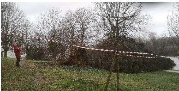
Heureusement cet arbre n'est pas tombé sur une des péniches garées rue Carolus