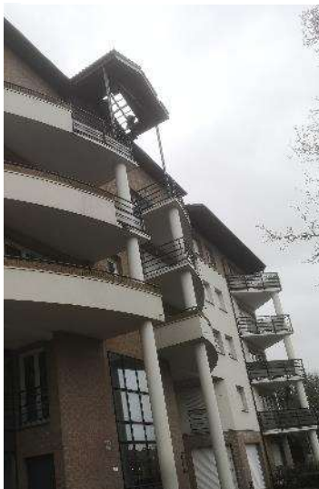
L'auvent des Terrasses de Boulogne II n'a pas résisté, envoyant une pluie de tuiles au sol.