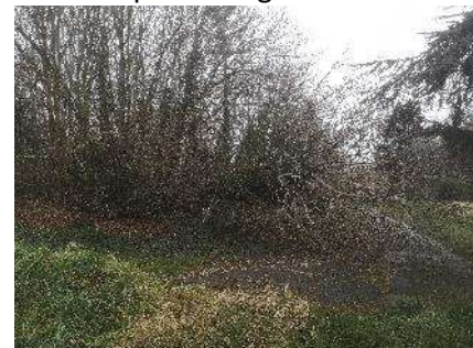
La plaine des Vachers a été peu touchée (devant la salle de sport à gauche, sur l'avenue de Dunkerque dessus à droite)