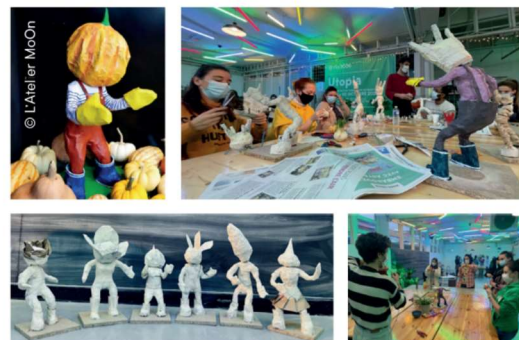
Ateliers au Tripostal / Décembre 2021

VEN 04 MARS 2022 9h > 12 ou 14h > 17h SAM 05 MARS 2022 14h > 17h Espace Pignon 11 rue Guillaume Tell, Lille Durée de l'atelier : 3h