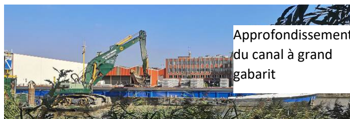
Approfondissement du canal à grand gabarit